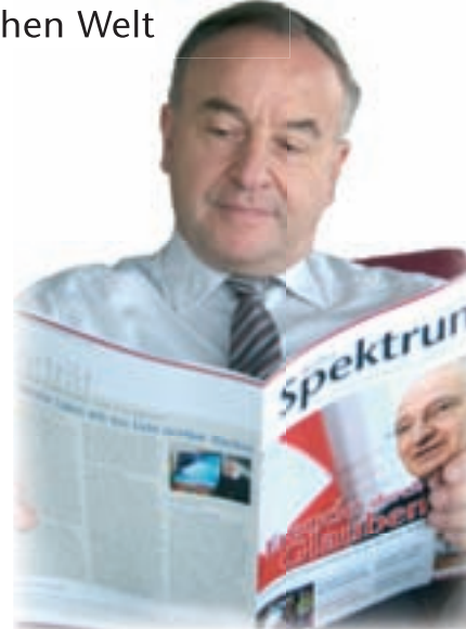
Seite 7: Analyse